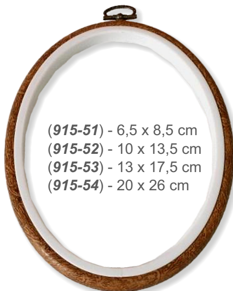
(915-51) - 6,5 x 8,5 cm (915-52) - 10 x 13,5 cm (915-53) - 13 x 17,5 cm (915-54) - 20 x 26 cm