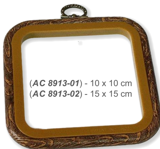
(AC 8913-01) - 10 x 10 cm (AC 8913-02) - 15 x 15 cm