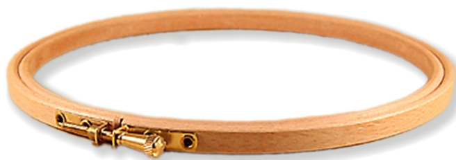
tamborek okrągły drewniany (AC 8803-01) - 15 cm (AC 8803-02) - 17 cm (AC 8803-03) - 20 cm (AC 8803-04) - 22 cm

Polecamy ramkotamborki, które można kupić na stronie internetowej www.coricamo.pl . Zapraszamy!