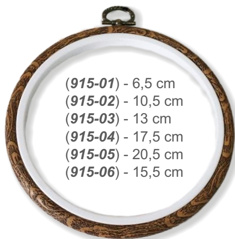
(915-01) - 6,5 cm (915-02) - 10,5 cm (915-03) - 13 cm (915-04) - 17,5 cm (915-05) - 20,5 cm (915-06) - 15,5 cm